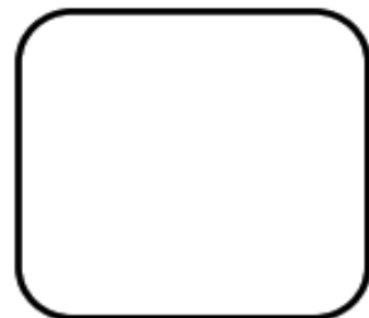
Huella Digital (Índice derecho)